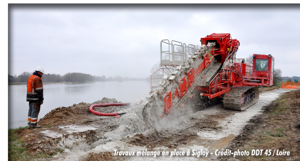
Travaux mélange en place à Sigloy

Ce programme pourra être adapté en fonction des conclusions de l'étude des vals du giennois en cours de réalisation ■